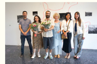
Diplômés du DNSEP/Master, lauréats du prix Point d'Or et du Coup de coeur Bliiida, juin 2023