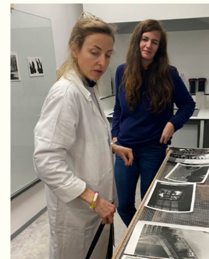
Enseignantes dans le Pôle photographie argentique et numérique de l'ÉSAL