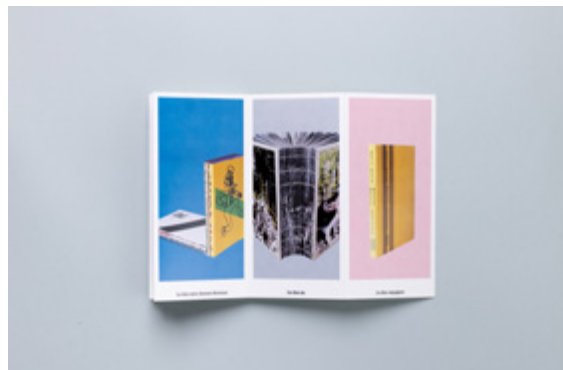
D'os — publication présentée à la biennale Exemplaires — ISDAT, Toulouse [Novembre 2021]