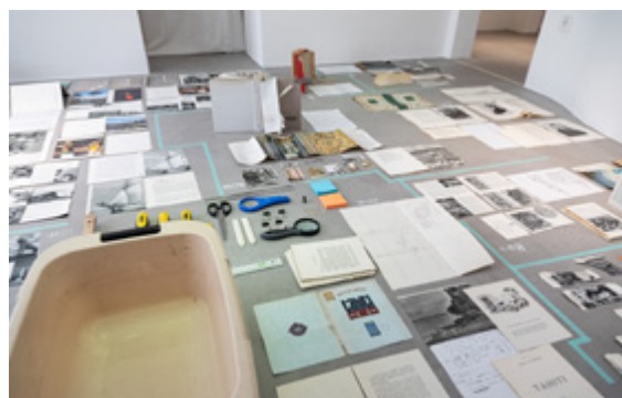
Frontières du texte — workshop et exposition — Casino display, Luxembourg [Avril 2022]