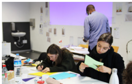
Annotation — workshop — Fachhochschule Potsdam, Allemagne [Octobre 2021]