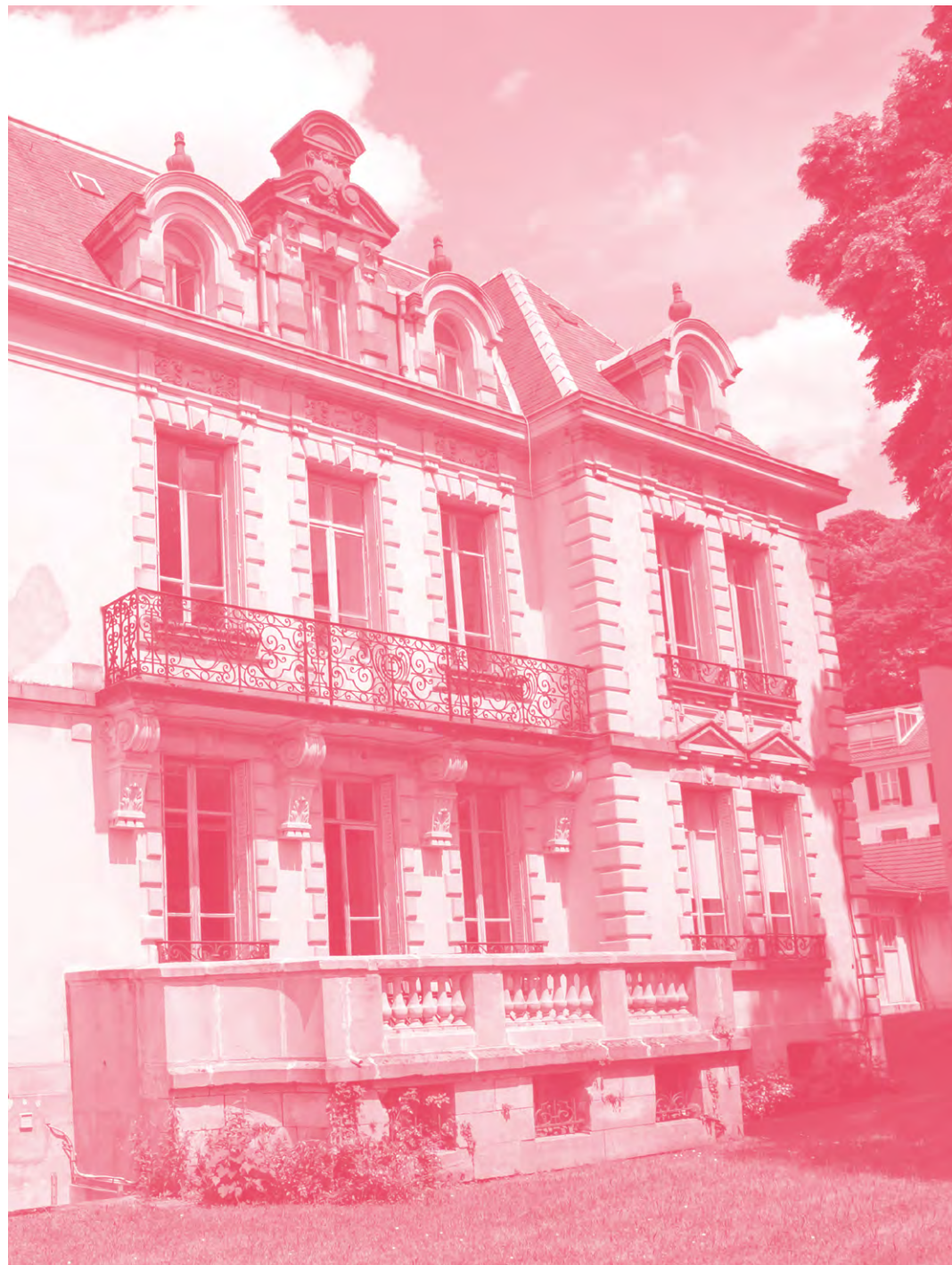
ÉSAL Pôle arts plastiques Épinal vue de face

Les Journées Professionnelles sont des moments privilégiés pour aborder avec des professionnels de l'art les préoccupations liées à l'entrée dans le monde du travail. L'ÉSAL, caractérisée par son attachement constant au territoire, est aussi ouverte aux échanges transfrontaliers et internationaux qu'elle élargit tous les ans. Les valeurs fondamentales de l'enseignement à l'ÉSAL reposent sur un engagement fort de tous ses acteurs, mais aussi sur une écoute et un investissement précieux de ses fondateurs : La Communauté d'Agglomération d'Épinal, l'Eurométropole de Metz et le Préfet de la Région Grand Est.