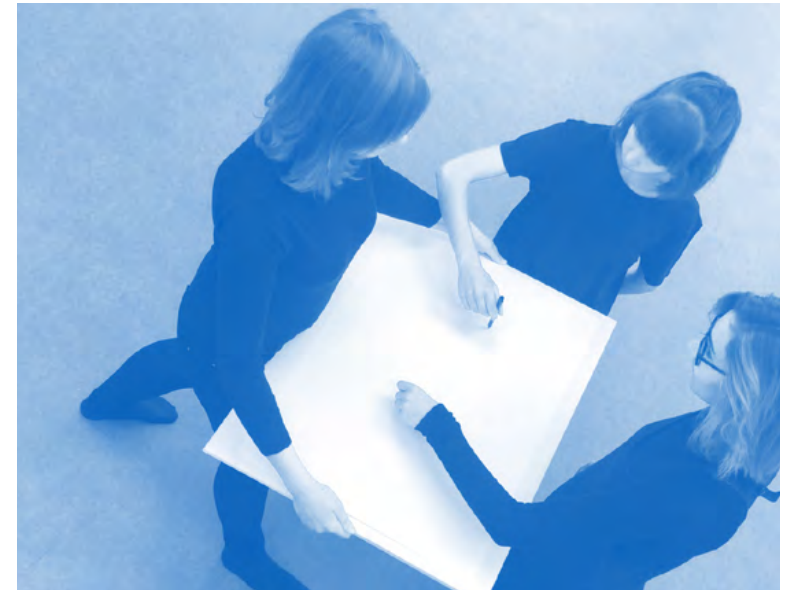
Jours tremplins, septembre 2019, crédits : ÉSAL

L'organisation des études du Pôle arts plastiques est régie par l'arrêté du 16 juillet 2013 portant organisation de l'enseignement supérieur d'arts plastiques dans les établissements d'enseignement supérieur délivrant des diplômes; modifié par arrêté du 8 octobre 2014.